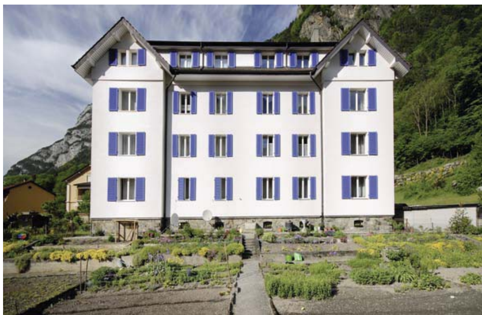
Das Sechsfamilienhaus der Wohnsiedlung Mohrenkopf, die von der Gotthardbahngesellschaft gebaut wurde.

Seit den 1850er-Jahren vermieteten paternalistisch gesinnte Fabrikanten günstigen Wohnraum an ihre Angestellten. Obwohl ein dringendes Bedürfnis für bezahlbaren Wohnraum bestand, war die doppelte Abhängigkeit vom Arbeitgeber nicht nur beliebt. Um 1890 baute die Schweizerische Centralbahn