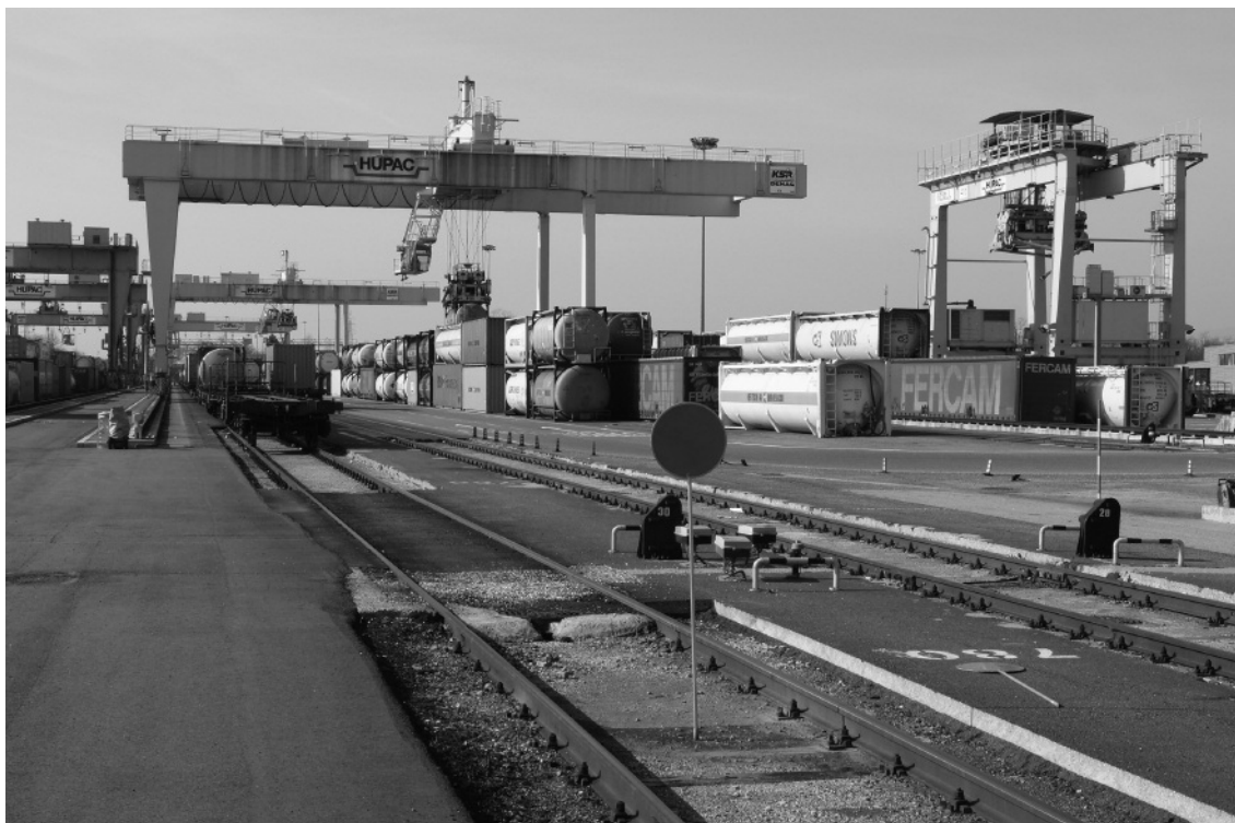
Abbildung 5: Im Computerterminal der HUPAC in Busto-Arizio bei Varese werden Wechselbehälter für den nächsten Transportschritt, beispielsweise die Feinverteilung auf einen Camion, umgeladen.