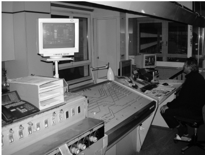
Abbildung 6: Stellwerk von innen mit drei Generationen von Stellwerken. Mit dem elektro-mechanischen Stellwerk (vorne) werden Signale und Weichen elektrisch betrieben und Fahrstrassen mechanisch verriegelt. Das Relaisstellwerk Domino 69 (Mitte) ist modular aufgebaut. Die Fahrstrassen werden mit Relais geschaltet. Im Hintergrund die Bildschirme mit Gleisbild des elektronischen Stellwerks und der Bedienung mit der Maus.