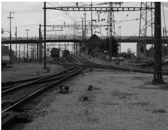
Abbildung 3: Sicht von der Richtungsgruppe auf den Ablaufberg mit zwei Höhen, eine für den Sommer und eine für den Winter.