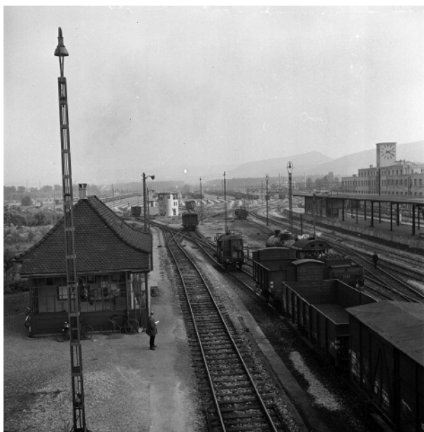
Abbildung 2: Rangierbahnhof MuttENZ BL: Sicht vom Ablaufberg Richtung Richtungsgruppe um 1941