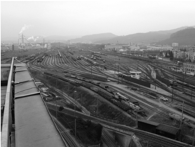
Abbildung 1: Blick Richtung Richtungsgruppe des Rangierbahnhofs von 1929. Rechts vorne werden die Güterwagen den Ablaufberg hinuntergestossen, im sechseckigen Stellwerk gebremst und in das richtige Gleis in der Richtungsgruppe gewiesen. (Bild: K. Elsasser)

Die Zusammenfassung von Transportbedürfnissen in Züge, die Minimierung des Rollwiderstands sowie die Möglichkeit, grosse Kapazitäten an Güter und Personen auf einer relativ kleinen Fläche zu transportieren, sind bei einem grossen Verkehrsaufkommen die ökologische und ökonomische Stärke des Systems Eisenbahn. Die enge Verzahnung von Infrastruktur und Betrieb macht die Eisenbahn zur über die Landschaft ausgebreiteten Maschine. Nachteile sind die komplexe Organisation der Zugsbildung und die Sicherstellung, dass sich immer nur ein Zug auf einem Schienenabschnitt befindet. Vor allem im Güterverkehr kommt dazu, dass die Zusammenstellung von Zügen spezielle Rangiergleise braucht. Seit den 1860er-Jahren wurden dafür spezielle Rangierbahnhöfe gebaut. 1890 kristallisierte sich die heutige Form des Rangierbahnhofs heraus, die aus einer Einfahrgruppe besteht, in der die Wagen voneinander getrennt werden, aus einer Richtungsgruppe, in der die Wagen zu neuen Zügen zusammengestellt werden und aus der Ausfahrtsgruppe, in der die neuen Züge für die Abfahrt vorbereitet werden.